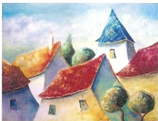
Danse des toits. Huile sur toile, 89 x 116 cm.

Mes toiles quand elles se font marines montrent des bateaux toutes voiles dehors ondulant sur les vagues. J'aime aussi peindre ces villages inspirés des contes, aux toits qui dansent et aux perspectives renversées. Mon dessin demeure toujours le même : l'hymne à la couleur et la ligne pour exprimer la vie (...). ■